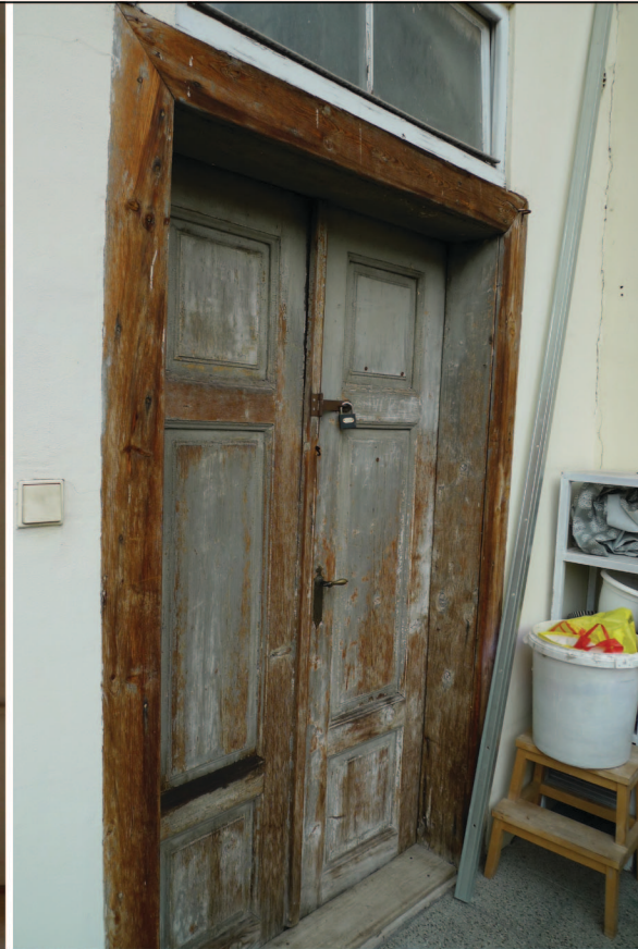
D2. VSTUPNÍ DVEŘE NA PAVLAČOVÝ ZÁCHOD S NADSVĚTLÍKOVÝM OKNEM, 1100 x 2180

Dvoukřídlé původní dřevěné kazetové dveře s nadsvětlikem