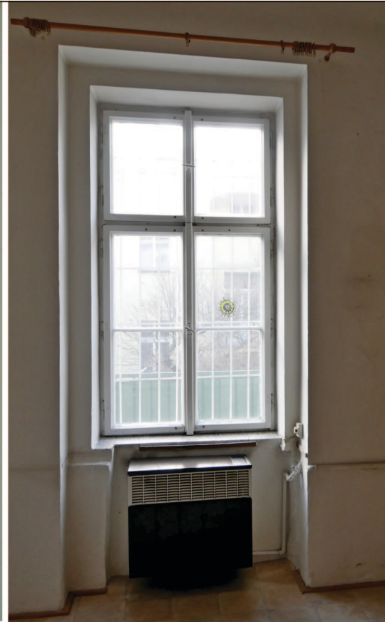
O2. OKNO 1100 x 2080

zdvojené (šroubované) novodobé, dřevěné otvíravé okno. Velikost a umístění je podle původního, dobového dvojitého okna.