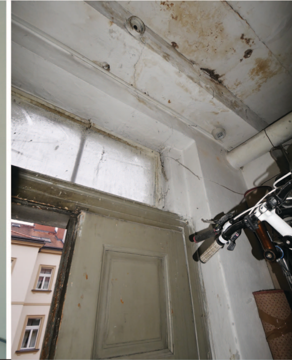
D2 pohled ze vnitř

Povrchová úprava - z vnitřní strany omšelý bílý nátěr, z vnější strany je nátěr značně poničený, z větší části je dřevo bez nátěru jen se zbytky po tmelení.