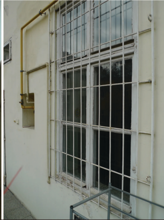
O2 pohled z venku