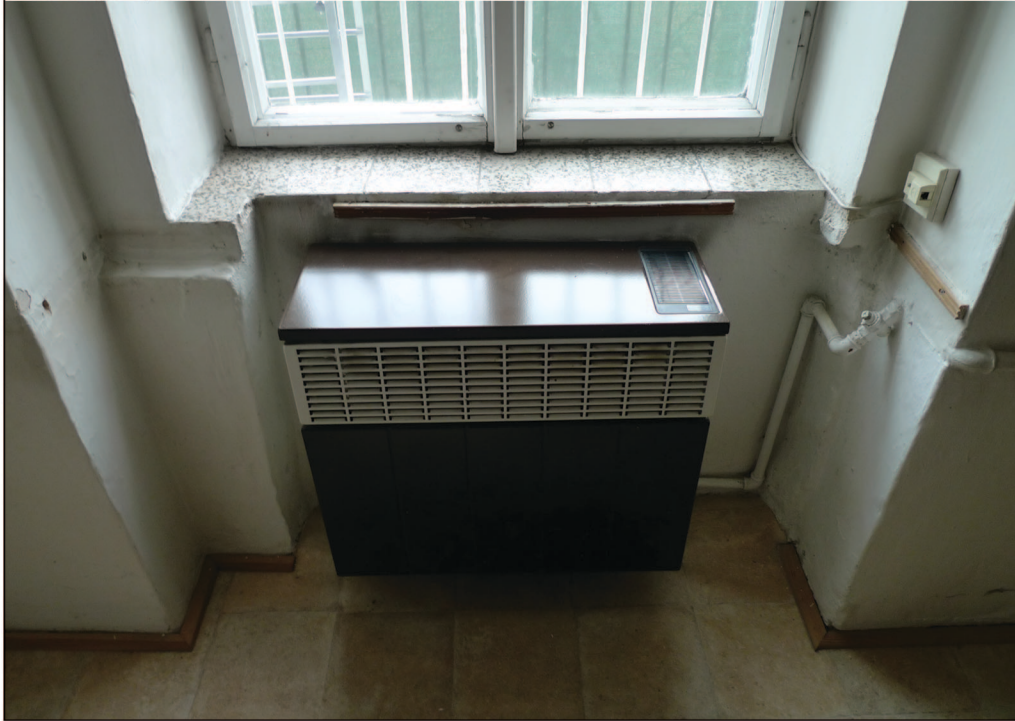
O2 detail parapetu

Okení křídlo - dřevěné, dvojité, dvoukřídlé, otvíravé. Podle detailů profilace se jedná o novodobější repliku stejné velikosti. Povrchová úprava - bílý nátěr.