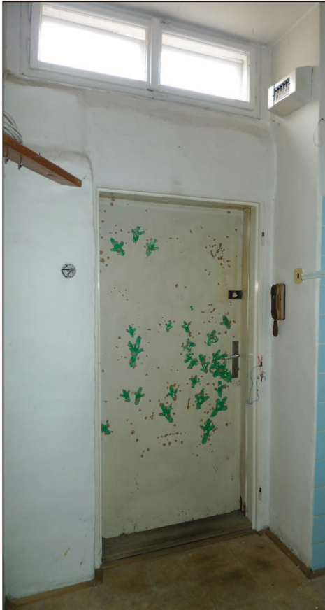
D1. VSTUPNÍ DVEŘE 900 x 2000, dvojité jednokřídlé novodobé dveře.